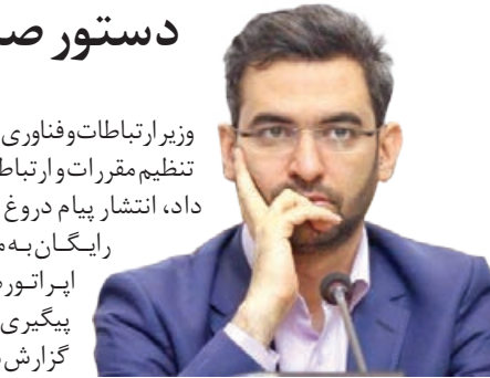
وزیر ارتباطات و فناوری اطلاعات به‌سازمان تنظیم مقررات و ارتباطات رادیویی دستور داد، انتشار پیام دروغ اختصاص اینترنت رایگان به مشترکان یکی از اپراتورهای تلفن همراه، پیگیری و رسیدگی شود. به گزارش مرکز روابط عمومی