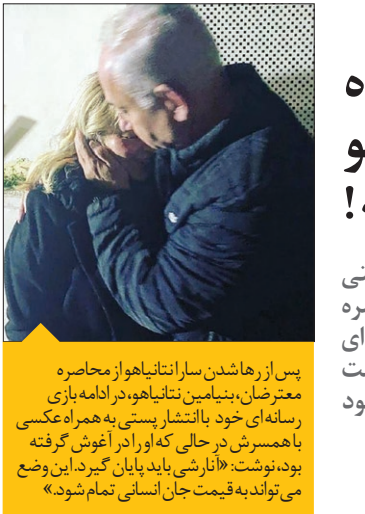
پس از هاشدن سارا نتانیا‌هو از محاصره معترضان، بنیامین نتانیا‌هو، در ادامه بازی رسانه‌ای خود با انتشار پستی به همراه عکسی با همسرش در حالی که او را در آغوش گرفته بود، نوشت: «نازنی باید پایان گیرد. این وضع می‌تواند به قیمت جان انسانی تمام شود.»

■ آمریکا با هم‌روسیه و چین را تحریم کرد همچنین وزارت تجارت آمریکا در بیانیه‌ای اعلام کرد که ۳۷ شخصیت حقیقی در فهرست سیاه تجارت برای فعالیت‌هایی شامل همکاری با ارتش روسیه، حمایت از ارتش چین و تسهیل یا دخیل بودن در نقض حقوق بشر در میانمار و چین قرار گرفته‌اند. به گفته «تی کندلر» دستیار وزیر تجارت آمریکا وقتی ما شخصیت‌های حقوقی را که تهدید ملی یا نگرانی سیاست خارجی برای ایالات متحده محسوب می‌شوند شناسایی می‌کنیم، آن‌ها را به فهرست سیاه می‌افزاییم تا مطمئن شویم که می‌توانیم نقل و انتقال‌های مالی آن‌ها را رصد کنیم. وی ادامه داد: ۳۷ شخصیت حقوقی در فهرست تحریم‌ها قرار گرفته‌اند که یا با ارتش روسیه همکاری دارند یا با ارتش چین.