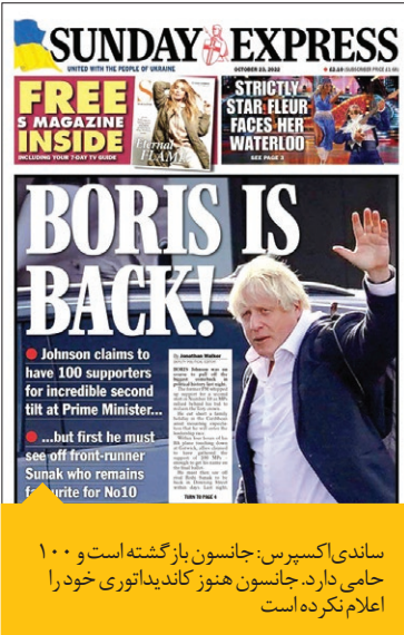
ساندی اکسپرس: جانشون بازگشته‌است و ۱۰۰ حامی دارد. جانشون هنوز کاندیداتوری خود را اعلام نکرده‌است

ریس‌ماگ، وزیر بازرگانی با تبلیغ برای بوریس جانشون، از نامزدی نخست‌وزیر اسبق حمایت کرده‌است. او پشتیبانی خود را با هشتگ Boris or Bust توپیت کرده که به معنای «بوریس یا بحران» است. این در حالی است که تحقیقات پارلمانی علیه جانشون در پرونده رسوایی پارتی