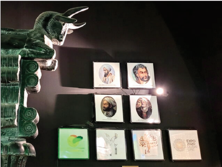
بخشی از تالار های ازبکستان و ایران (به ترتیب، عکس های بالا و پایین) در اکسیو دبی