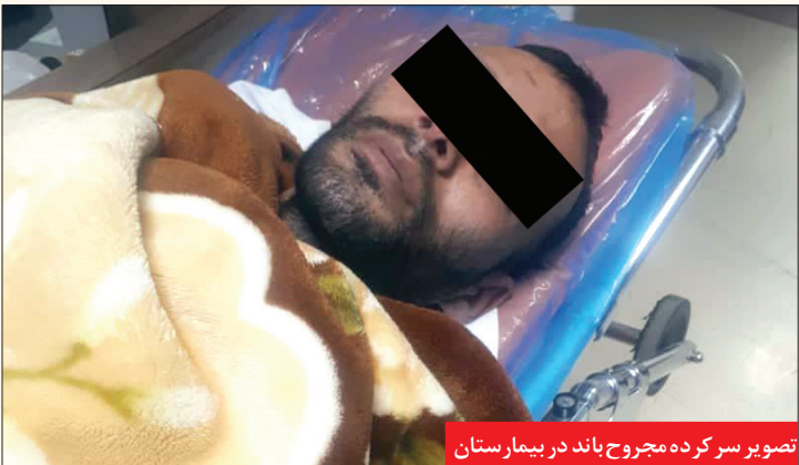
تصویر سرکرده مجروح باند در بیمارستان

تخریب خودروها حال طبیعی نداشتند و مشروبات الکلی مصرف کرده بودند اما آن ها در پاسخ به سوال سرهنگ دهقان پور که پرسید «اگر حال طبیعی نداشتید پس چگونه متوجه حضور نیروهای انتظامی شده بودند، پدال گاز را فشر دند تا با فرار از چنگ قانون،