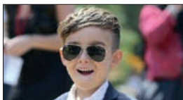
آلونسوماتئو تعداد فالوئر هادر اینستاگرام: ۵۵۶ هزار نفر

«آنا» یکی دیگر از بچه‌معروف‌های دنیای مد، متولد ۲۰۰۹ در سنسنت پترزبورگ روسیه است. نخستین عکس مدلینگ او، زمانی که فقط سه سال داشت، گرفته شد و همه از دیدن آن شگفت زده شدند. «آنا» اکنون ۹ سال دارد و در فیلم‌های روسی مختلفی هنرنمایی کرده‌است. چشم‌های آبی پر رنگی که در آنجا، او، کار بازیگر دنیای مدرن تحت تأثیر قرار داده‌است.