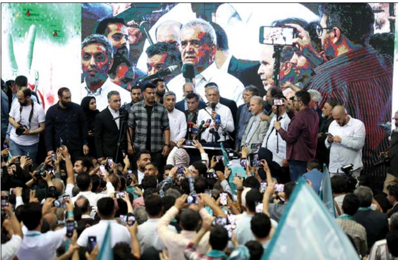
■ پزشکیان: رای ندادن، رای به تداوم وضعیت موجود است

انتخاباتی هوادارانش حضور یافت. صحبت های هر یک از این ۳ نامزد انتخاباتی بر طر فدار ی بود که رقابت اصلی در روز جمعه بین آن