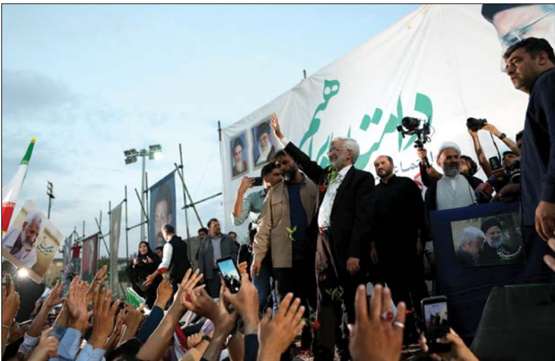
■ قالیباف: کشور تاب اختلاف ندارد

بیباندو در این کشور نقشی ایجاد کننده این که در خارج بمانند.