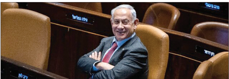
پارلمان رژیم صهیونیستی با لایحه‌ای جنجال برانگیز موافقت کرد که تعلیق فعالیت نخست‌وزیر اسرائیل را دشوار می‌کند

به گفته وزیر دادگستری برزیل، ژائیر بولسونارو در تحقیقات مرتبط با تلاش برای وارد کردن غیرقانونی جواهرات اهدایی از سوی عربستان به این کشور به ارزش ۳/۲ میلیون دلار، در دادگاه شهادت خواهد داد. در این میان، بولسونارو اعلام کرد که دو موافقت کرده تا جواهرات اهدایی از سوی عربستان را به مقام‌ها تحویل دهد. این هدایا در پایان سال ۲۰۲۱ در عربستان سعودی به بولسونارو تحویل داده شد، زمانی که شرکت نفت دولتی پتروبراس به تازگی یک پالایشگاه به مبلغ یک میلیارد و ۸۰۰ میلیون دلار به گروهی در عربستان سعودی فروخته بود.