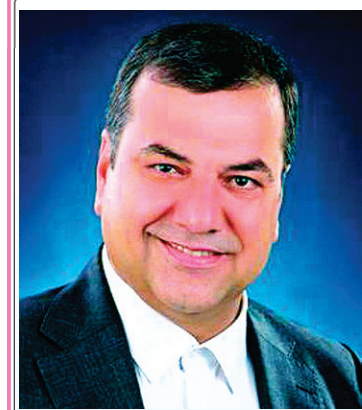
جناب آقای حسین محمدیان

حمله به کنگره بازخواست می‌کند. پنس آن چه در آن روز اتفاق افتاده، مایه شرمساری خوانده بود. به نوشته خبرگزاری «رویترز»، او که در حال بررسی نامزدی خود از حزب جمهوری خواه برای انتخابات ریاست جمهوری ۲۰۲۴ آمریکا است، تأکید کرد: «می‌دانم که تاریخ، دونالد ترامپ را [برای حمله به کنگره] بازخواست می‌کند، این سیاستمدار آمریکایی اظهار کرد: «آن چه در آن روز اتفاق افتاد، مایه شرمساری بود. تا زمانی که زنده هستم، هرگز و هرگز صدمات وارد شده، جان‌های از دست رفته یا قهرمانی مجریان قانون در آن روز غم انگیز را کوچک جلوه نخواهم داد». در نتیجه حمله به کنگره آمریکا بعد از انتخابات ریاست جمهوری ۲۰۲۰ آمریکا که باعث تعطیلی چند ساعته جلسه تأیید آرای انتخابات ریاست جمهوری این کشور شد، حداقل پنج نفر کشته و ده هانفر زخمی شدند. پیش از این، بر اساس شهادت مایک پمپئو فاش شد، در روزهای بعد از حمله به کنگره آمریکا در ژانویه ۲۰۲۱، برخی از اعضای کابینه دونالد ترامپ درباره درخواست استعفایا کنار گذاشتن جمهوری خواه برای رأی دادن به او در انتخابات ریاست جمهوری ۲۰۲۴ - در حالی که پنس هنوز نامزدی خود را اعلام نکرده - افزود: «او فهمیده که دیگر ظاهر سازی فایده ندارد. او در حال تبلیغات بسیار شدید برای خود است». پنس شامگاه شنبه با بیان این که اظهارات ترامپ در روز ششم ژانویه ۲۰۲۱ باعث به خطر افتادن جان خانواده او و همه افراد حاضر در کنگره شد، گفته بود که تاریخ، ترامپ را برای