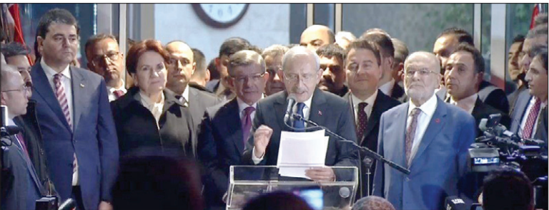
نتایج نظرسنجی جدیدی نشان می‌دهد نامزد ریاست جمهوری ترکیه از حزب اپوزیسیون، برتری ۱۰ درصدی بر اردوغان دارد

ساعت‌ها پس از بررسی‌های داغ در کنست، نمایندگان در خوانش اولیه با لایحه جنجالی اصلاحات قضایی ارائه شده از سوی نتانیاهو موافقت کردند. ۶۱ نماینده از مجموع ۱۲۰ نماینده به نفع لایحه پیشنهادی رای دادند و ۵۱ تن در شور اولیه با آن مخالفت کردند؛ اما بقیه نیز با غایب بودند رای امتنع دادند. این لایحه قبل از ورود به مرحله اجرایی برای تصویب