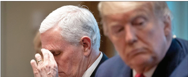
ترامپ حمله هواداران‌ش به کنگره را گردن معاوض انداخت

را به زندان بپندازند. این قانون حتی فراتر رفته و می‌گوید، دادگاه عالی هیچ اختیاری در زمینه وارد کردن اتهامی به نخست‌وزیر ندارد. این لایحه از سوی اوفیر کاتس، عضو حزب لیکود (حزب بنیامین نتانیاهو) و رئیس ائتلاف ارائه شده که عزل نتانیاهو را تقریباً ممنوع می‌کند. این در حالی است که تظاهرات گسترده‌ای علیه تغییرات قضایی هر شنبه و برای دهمین هفته متوالی برگزار شده است. گالی باه‌اراف، دادستانی کل هشدار داده این تغییر منجر به موضوعی سیخ می‌شود و خلأیی سیاه ایجاد می‌کند، زیرا مانع از هر گونه نظارت حقوقی می‌شود. این در حالی است که اسحاق هرتزوگ، رئیس رژیم صهیونیستی درباره اختلافات شدید در خصوص اصلاحات قضایی و حقوقی که پیامدهایی خطرناک علیه این دولت دارد، هشدار داد و افزود: ممکن است این اصلاحات پیامدهایی دیپلماتیک، اقتصادی، اجتماعی و امنیتی داشته باشد. هرتزوگ گفت: ما در وضعیت بدی هستیم... بسیار بد. او وضعیت موجود را «درگیری داخلی که ما را از بین