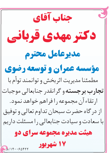
۱۷ شهریور ۱۴۰۲