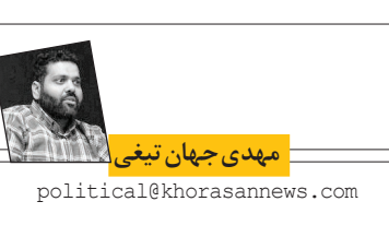
مهدی جهان تیغی.

دستور کار خود قرار داده است اما نکته مهم آن جاست که رئیس‌ی صرفاً خود را محدود به چند سفر خارجی نکرده‌و در کنار آمدو شده‌ایش به خارج از کشور، از ابتدای فعالیت خود مدام به رئیس‌ی نیز تا این جای کار و پس از گذشت ۷ ماه از آغاز به کار دولتش که با محوریت وریکردی متفاوت راجع به تعامل با دیگر کشورها از همان ابتدا به دنبال تحقق «دیپلماسی همسایگی» بوده است، سه سفر مهم و راهبردی یعنی سفر به تاجیکستان، ترکمنستان، روسیه و قطر را در