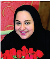
بازگشت همه به سوی اوست