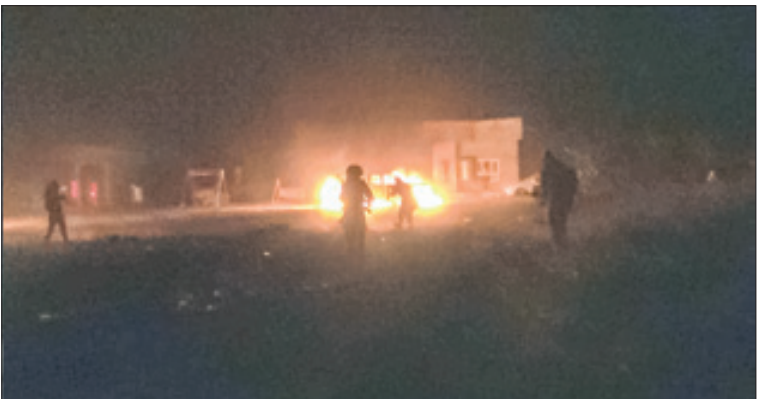
یکشنبه ۱۴ اردیبهشت ۱۳۹۹ ۹ رمضان ۱۴۴۱. شماره ۲۰۳۶۹

دوپچه‌وله: زندگی در تایلند با همه گیری ویروس کرونا به بن‌بست رسیده است. خیابان‌های معمولاً شلوغ بانکوک متروک شدند. فرودگاه سوارانابومی که به‌طور معمول قطب گردشگری بین‌المللی است، شاهد از بین رفتن ترافیک معمول خود است. صنعت گردشگری حیاتی تایلند که در سال ۲۰۱۸ حدود ۲۰ درصد تولید ناخالص داخلی این کشور تشکیل می‌داد، متوقف شده است. در دوره بحران، مردم از رهبرانشان انتظار دارند هم‌بستگی و دلگرمی نشان دهند اما ماها و اجیر الونگکون، پادشاه تایلند عمدتاً در دوران شیوع کرونا در کشورش حضور نداشت. او ترجیح داد تا این دوران بحرانی را در هتلی لوکس در کوه‌های آلپ بایرن بگذراند. پادشاه خوش گذران تایلند، این قرنطینه را در انزوا سپری نمی‌کند؛ در میان همراهان ۱۰۰ نفری او حداقل ۲۰ زن به چشم می‌خورند. در اواخر ماه مارس، رسانه‌های آلمانی گزارش دادند که پادشاه تایلند در یک هواپیمای شخصی بوئینگ ۷۳۷ در حال گشت‌زنی در اطراف آلمان بود و از هانوفر، لایپزیگ و درسدن بازدید کرد. و اجیر الونگکون حتی از هواپیمایاده نشده و مستقیماً پس از فرود دوباره به هوا بر خاسته است. پادشاه تایلند بار فثارهای عجیب و غریبش شناخته شده است. او در اکتبر ۲۰۱۶ جایگزین پدرش بود و طی مراسمی در مه ۲۰۱۹ رسماً سلطنت را آغاز کرد. او به جای حرکت در مسیر پدرش که در میان مردم تایلند محبوبیت داشت، سوابی به‌بار می‌آورد.