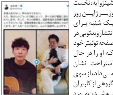
شینزو آبه، نخست‌وزیر ژاپن روز یکشنبه برای انتشار ویدئویی در صفحه توئیتر خود که او را در حال استراحت نشان می‌داد، از سوی گروهی از کاربران به شدت مورد

انتقاد قرار گرفت. ویدئوی آبه، در واقع پاسخ به درخواست عمومی یک نوازنده پر طرفدار ژاپنی به نام گن هوشینو بود. گن هوشینو به تازگی فیلمی از خود در حالی که گیتار می‌نواخت و می‌خواند در شبکه‌های اجتماعی منتشر کرد؛ محتوای ترانه او درباره رقصیدن در داخل خانه در دوران شیوع کرونا بود و از دیگران هم خواسته بود همین کار را انجام دهند. آبه هم ویدئویی از خود منتشر کرد که او را در حالی که روی کاناپه نشسته بود نشان می‌داد. نخست‌وزیر ژاپن جای می‌نوشید، کتاب می‌خواند و با سگش بازی می‌کرد. او به همراه این ویدئوییابی منتشر کرده بود با این مضمون که «در خانه بمانید».