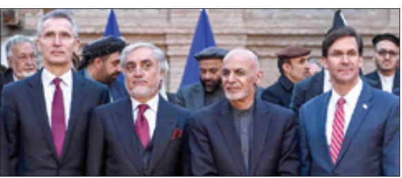
رئیس‌جمهور افغانستان، اشرف غنی

لشکر دوم «الجیش الوطنی» تصاویری از انتقال تجهیزات و شبه نظامیان به حومه شمالی استان ادلب منتشر کرد که در میان آن‌ها تجهیزات ضد هوایی و خودروهای «پیک‌آپ» دیده‌می‌شده هفته گذشته نیز لشکر یکم این گروهک تروریستی تجهیزات و نیروهای جدید به مناطق غرب استان حلب ارسال کرد و «بوقصی» از مدیران بخش اطلاعات سانی این گروهک در گفت‌وگو با وب سایت عنب بلدی از ساخت پایگاه های جدید و تشکیل گردان‌های کتیر انداز، توپخانه و ضد هوایی و همچنین یگان پیکانده نظام خبر داد