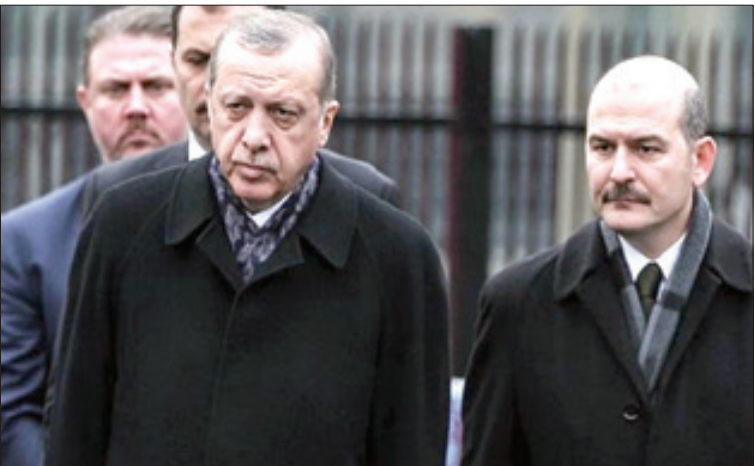
۲۰ شعبان ۱۴۴۱، شماره ۲۰۳۵