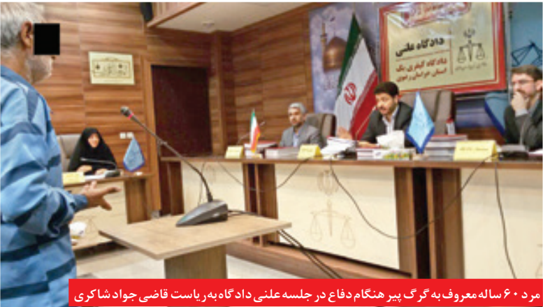
مرد ۶۰ ساله معروف به گرگ پیر هنگام دفاع در جلسه علنی داد گاه به ریاست قاضی جواد شاکری

نمی خورد ولی ۱۰ هزار تومان به او دادم و رفت. گزارش خراسان حاکی است، اما پیر مرد ۶۰ ساله وقتی دید جملات ساختگی او مورد توجه قاضی و کارآگاهان قرار نمی گیرد به ناچار حقیقت ماجرا را بیان کرد و گفت: اورا به پنهان دادن پول به باغ