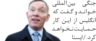
جنگی بین‌المللی خواند و گفت که انگلیس از این کار حمایت نخواهد کرد.

سخنگوی دفتر نخست‌وزیری انگلیس با انتقاد غیر مستقیم از تهدید رئیس‌جمهور آمریکا مبنی بر هدف قرار دادن اماکن فرهنگی ایران، این اقدام را نقض معاهده‌های