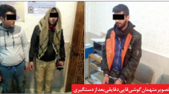
تصویر متهمان گوشی قاپی دقایقی بعد از دستگیری

رصد های اطلاعاتی با همکاری بازاریان مشهدی، در حالی به دستگیری در دنان نقابدار انجامید که تا کنون حدود ۱۸ شاکی موتور سواران گوشی قاپ را در حوزه استحفاظی کلانتری میرزا کوچک خان مشهد شناسایی کرده اند. فرمانده انتظامی مشهد روز گذشته با بیان این مطلب و در تشریح شیوه های جدید عملیاتی پلیس برای مبارزه با جرایم کیف زنی و گوشی قاپی به خراسان گفت: بررسی کارشناسی و تجزیه و تحلیل های پلیسی پرونده های گوشی قاپی در برخی نقاط شهر حاکی از آن بود که بیشتر سرعت ها در ساعات خلوت بین ۱۴ تا ۱۶ رخ داده است.