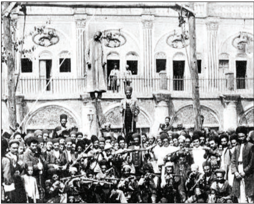
تاریخچه مجازات در ایران

یکی از مداخل میرغضب ها، پیش از پیروزی انقلاب مشروطه، گرفتن پول گدایی مجرم بود؛ تعجب نکنید! جلاد، قبل از این که مجرم را به محل اعدام ببرد، او را در کوچه و خیابان می گرداند و وادار می کرد گدایی کند. ماحصل گدایی قبل از مرگ مجرم بخت برگشته، دست لاف جناب میرغضب بود. گاه پیش می آمد که مردم تمایلی به پرداخت پول بابت گدایی فرد محکوم نداشتند؛ آن وقت