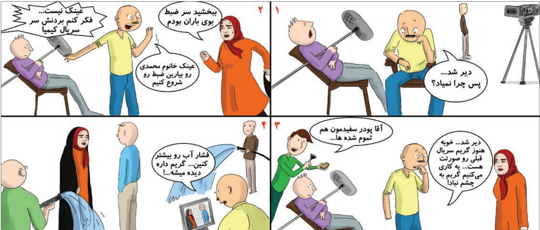
کار نویسند: صدیقه جعفریان