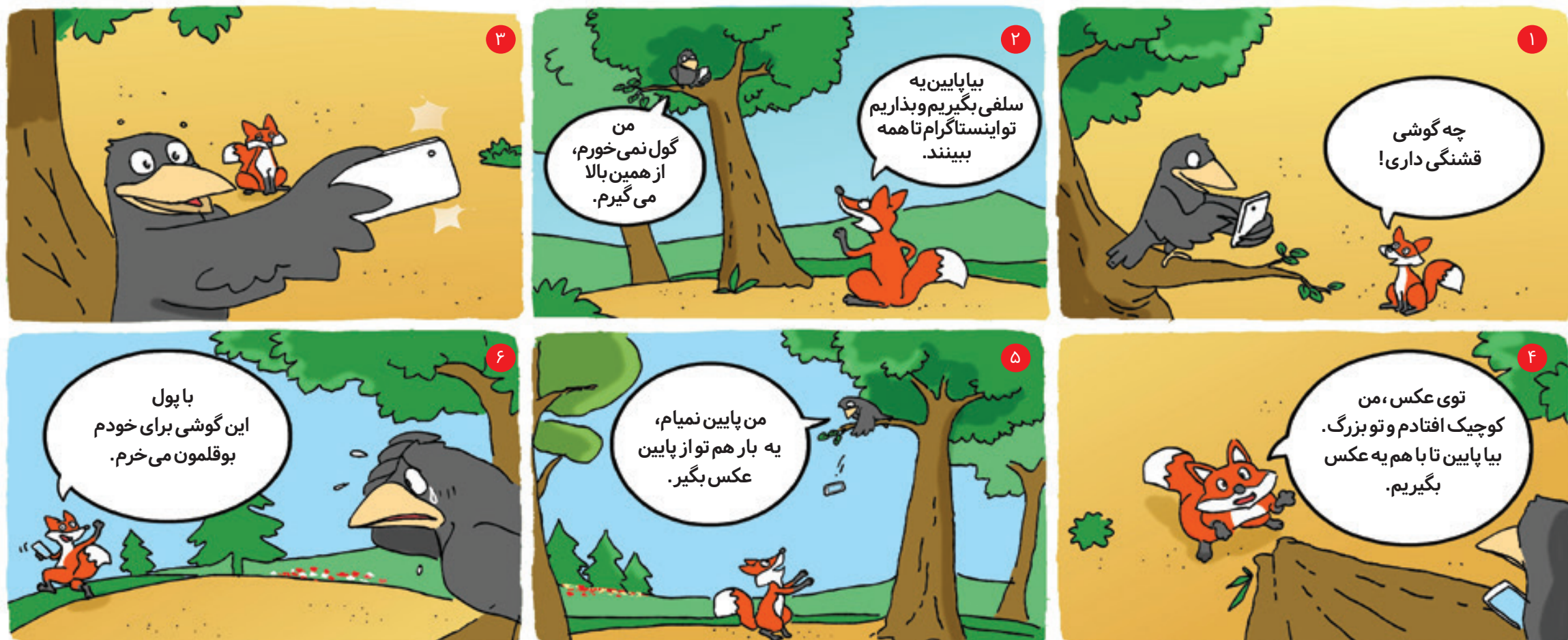
نویسنده: فاطمه رضایی بروفیه تصویرگر: سعید مرادی