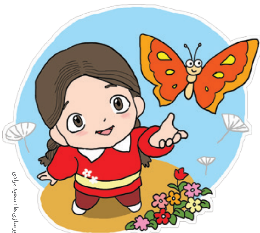
تصویرسازی ها: سعید مرادی