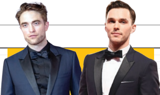
نامزدهای ایفای نقش بتمن مشخص شدند

رابرت پتینسون و نیکلاس هولت برای بازی در نقش «بتمن» تست می‌دهند. فیلم «بتمن» که توسط مت ریوز کارگردان سه‌گانه «سپاره میمون‌ها» ساخته خواهد شد، هنوز به مرحله فیلم‌برداری نرسیده و قرار است تابستان ۲۰۲۱ روی پرده سینماها برود.