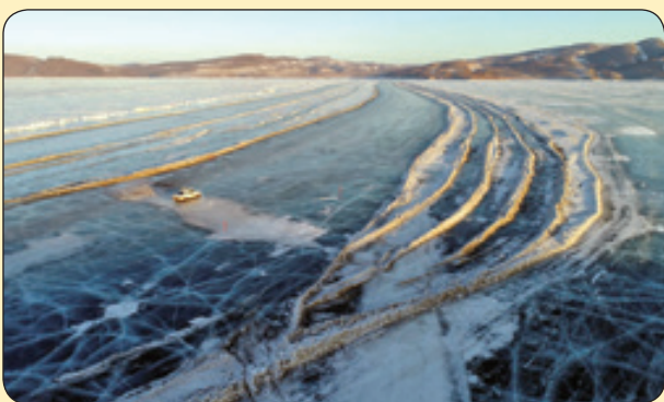
ماشین سواری روی رودخانه یخ زد، روسیه