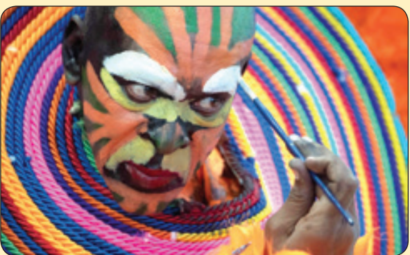
مردی از اهالی هائیتی خود را برای شرکت در جشنواره گردشگری گریم می کند، آلمان