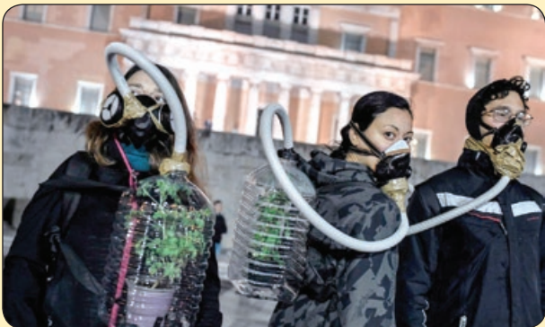
فرانس پرس | اعتراض فعالان محیط زیست به اکتشاف نفت در آب های یونان

چقدر دیر آمدی حالا که لب هایم را گم کرده ام چگونه با تو حرف بزنم!