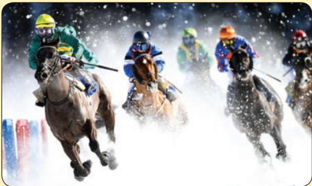
گتی |بیج | مسابقات اسب سواری در سرمای سوئیس

آلوده، آموزش و توانمندسازی مردم برای احترام به منابع طبیعی است که با این کار عشق به اقیانوس ها را ترویج می دهد. «فرانسیس موتوا» که پیشتر به حرفه مثبت کاری مشغول بوده، اکنون عضو خانواده ۹۰۰