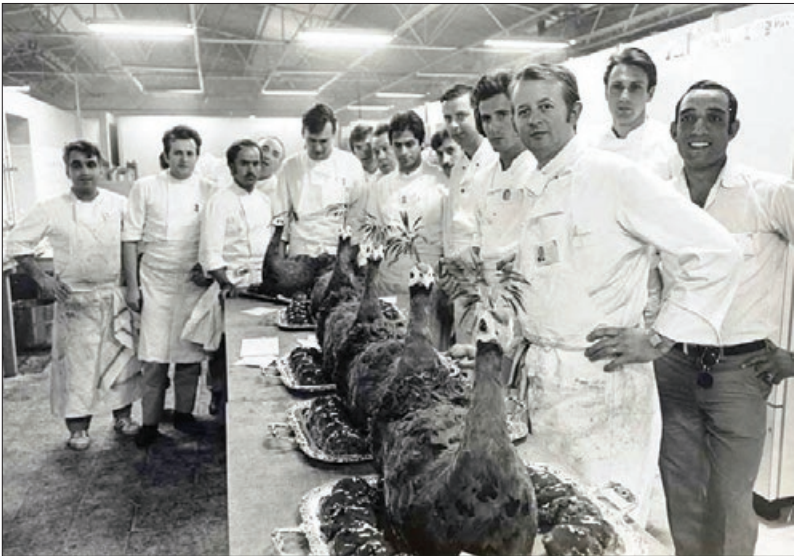
خوراک‌های طاووسی که با هزینه‌های هنگفت توسط آشپزهای فرانسوی، تهیه و به ایران ارسال شد.

مقدمات برگزاری جشن‌های ۲۵۰۰ ساله بود. طرح مقدماتی برگزاری این جشن، توسط شجاع‌الدین شفا در سال ۱۳۳۷، به شاه ارائه و تصویب شد. قرار بود جشن را در سال ۱۳۴۰ برگزار کنند، اما هزینه سنگین آن باعث شد که زمان برگزاری، ۱۰ سالی به تعویق بیفتد و سرانجام در سال ۱۳۵۰، برگزار شود؛ جشنی که به اعتقاد بسیاری از تحلیل‌گران داخلی و خارجی، یکی از دلایل اصلی گسترش اعتراضات و در نهایت، سقوط رژیم پهلوی بود.