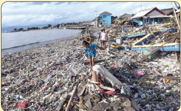
گاردین | جست‌وجو در بازمانده‌های سونامی، اندونزی

دور چون با عاشقان افتد تسلسل بایدش کیست حافظ تا ننوشد باده‌بی‌آواز رود عاشق مسکین چرا چندین تجمل بایدش