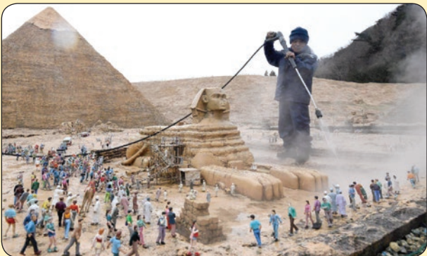
گدی‌های مصر در پارک مینیاتوری، ژاپن