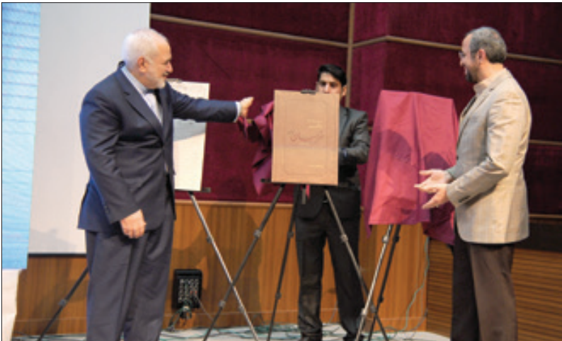
مراسم رونمایی از «خراسان نامه» با حضور دکتر ظریف، وزیر خارجه، برگزار شد

«تاریخ مختصر احزاب سیاسی»، آن‌را جایگاه نخستین تک‌پوهای روزنامه‌نگاری خودمی‌داند.