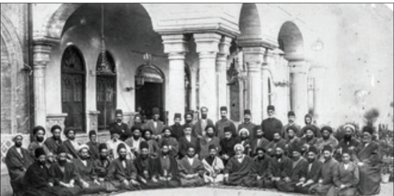
نمایندگان نخستین دوره مجلس شورای ملی