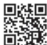
تصویرسازی: سحر صدارت

دوست شود، می‌آید و درست بین‌شان، روی کابل برق می‌نشیند و به‌خاطر وزنش، کابل پایین و پایین‌تر می‌رود و پرنده‌های کوچک، حساسی شاکی می‌شوند... اگر دوست دارید بدانید ادامه ماجرای این معاشرت به کجا می‌رسد، از بزرگ‌ترها بخواهید این کارتون بسیار کوتاه را که برنده جایزه اسکار هم شده، با استفاده از این کی‌ور کد دانلود کنند تا ببینید.