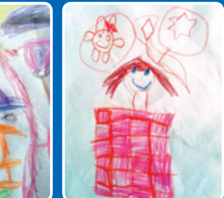
سیده یسنا سرابی