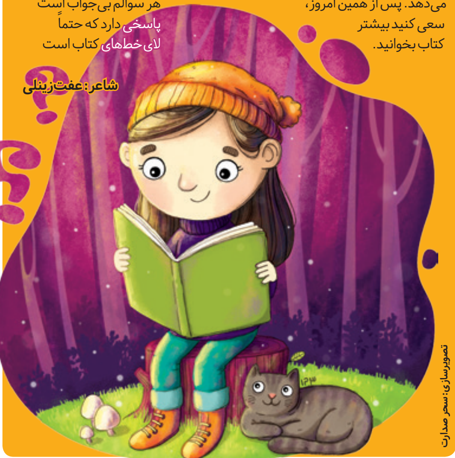
تصویرسازی: سحر صدارت