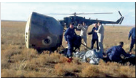
فرمانوردان فضاییمای سوزپس از اینکه در هنگام پرواز دچار نقص فنی شد، مجبور به فرود اضطراری در قزاقستان شدند.