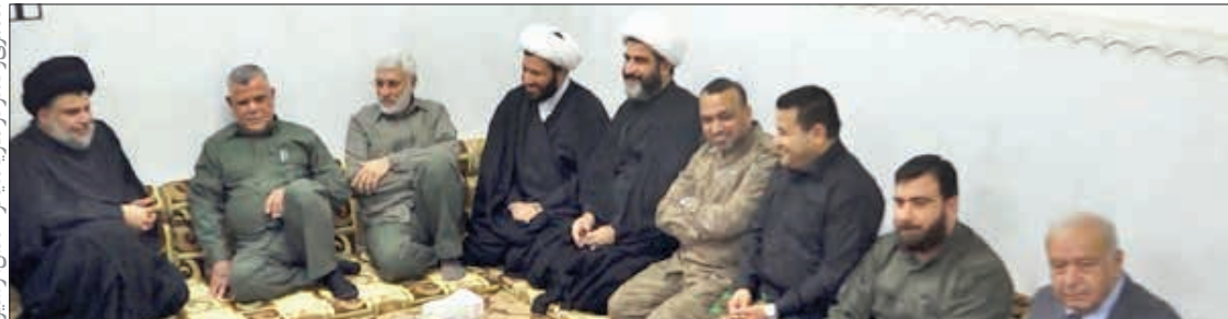
نماینده صدر در کلنیکدرو-حکیم ز شید

لیست مقتدی صدر، العامری و العبادی به ترتیب بیشترین کرسی های پارلمان را کسب کردند