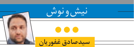
نیش و نوش به رفتار های مطلوب و نامطلوب اجتماعی می پردازد