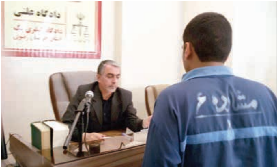
سجاد در آخرین جلسه دادگاه که به ریاست قاضی علیزاده در سال ۹۵ برگزار شد

را به صحنه جنگ تبدیل کرده ایم. از سبوی دیگر هم، کله ها در این سن و سال باد دار دو خیلی ها مانند من عقده خودنمایی دارند.