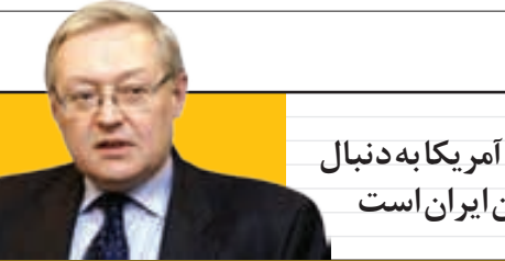
ریاکوف: آمریکا به دنبال بی ثبات کردن ایران است