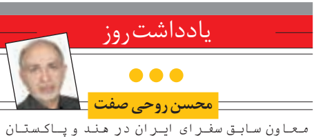
معاون سابق سفرا ایران در هند و پاکستان