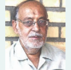
اینگ کهزستان نشین هجران