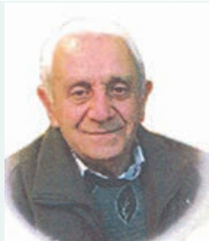
با نهایت تأسف و تأثر در گذشت مرحوم شادروان