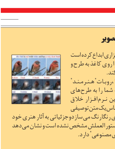
یک تصویر از یک پرنده که با استفاده از فناوریهای جدید، قادر به تغییر شکل و تبدیل شدن به یک تصویر است.

تعارضات واحد امکان قبل از دستگاه قضا در معاونت حقوقی رئیس جمهور حل و فصل شود. وی ادامه داد: متولی شیوه کار یابی سنتی وزارت کار است اما اکنون برخی استارت آپ ها به عنوان سایت های کار یابی وارد این حوزه شده اند و این منجر به ایجاد تعارضاتی شده است. گاه استارت آپ ها با درخواست دستگاه قضا مبنی بر ارائه دیتابیس مواجه می شوند در حالی که تمام مزیت یک استارت آپ دیتابیس آن است و بنابراین اگر امتناع شود، با فیلتر ینگ مواجه می شود. وی همچنین از تصمیم دولت برای تدوین لایحه ای در خصوص کسب و کار های نوین خبر داد. حکیمی، معاون فناوری اطلاعات بانک مرکزی نیز با تاکید بر لزوم نظارت دقیق بر فعالیت فن تک ها گفت: بانک مرکزی در زمینه حوزه های پر داخت از این پس مجوزی صادر نخواهد کرد و از طریق تعریف چارچوبی برای ارزیابی به دنبال نظارت بر شرکت های پرداخت بر فن تک ها خواهد بود.