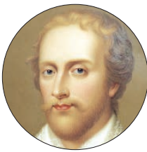
«ادموند اسپنسر» ۱۳ ژانویه ۱۵۹۹

گروه ادب و هنر – هنرمندان عرصه فرهنگ و هنر، نقش بی بدلی در فرهنگ سازی جامعه‌های بشری دارند. در هفته پیش رو یعنی از ۲۳ تا ۲۸ دی ماه، مناسبت‌هایی از جمله سالروز درگذشت یک شاعر برجسته انگلیسی، درگذشت معروف ترین رهبر