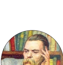
«ماکسیم گورکی» ۱۸ ژانویه ۱۹۳۶