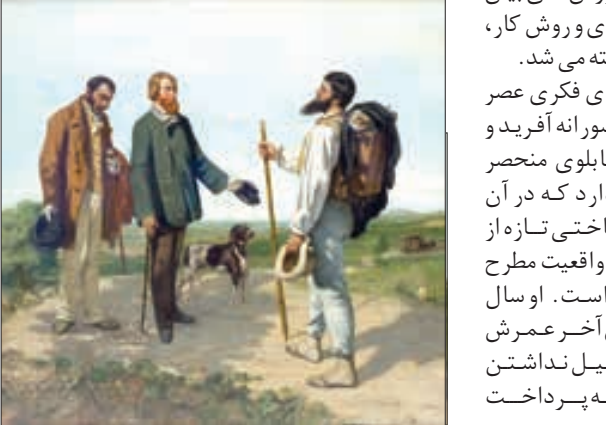
تابلویاز سال ۱۸۵۳ میلادی

را نقاشی کند. روش نقاشی او در نظر معاصرانش به طرز تحمل‌ناپذیری خام بود، چرا که «کوره» به بعد در جست‌وجوی ساده‌ترین و صریح‌ترین روش‌های بیان بود؛ او لحاظ ترکیب‌بندی و روش کار، هنرمندی ابتدایی پنداشته می‌شد. «کوره» بر پایه دستاوردهای فکری عصر خود، آثاری جسورانه آفرید و حدود ۳۰ تابلوی منحصربه‌فرد دارد که در آن‌ها شناختی تازه از مفهوم واقعیت مطرح شده است. او سال‌های آخر عمرش به دلیل نداشتن هزینه پرداخت