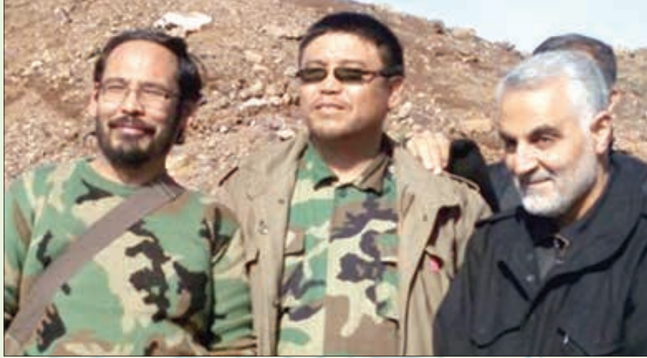
دو فرمانده شهید در کنار سردار