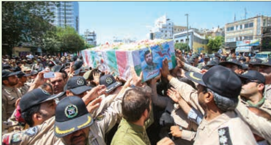
شهید جواد موسوی ثانی از دلوران ارتشی مدافع حرم بود