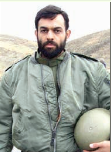
پیکر شهید قاسمی دانا همزمان با سالروز وفات حضرت زینب (س) در مشهد مقدس تشییع شد