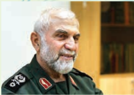
شهدان حماسه ساز دفاع از حریم اهل بیت و جبهه مقاومت اسلامی، سردار حسین همدانی و سردار محسن قاجاریان