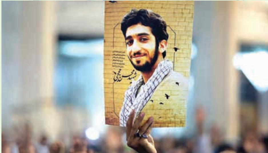
شش مهر ۱۳۹۶ پس از شهادت مظلومانه شهید مدافع حرم، محسن حججی، سردار حاج قاسم سلیمانی فرمانده سپاه قدس وعده داد تا کمتر از سه ماه دیگر کار گروهک تروریستی داعش در عراق و سوریه تمام شود