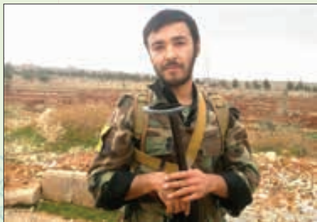
شهید صابری نمونه‌ای از صبر بود