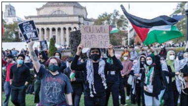
گسترش اعتراضات ضداسرائیلی در دانشگاه‌های آمریکا