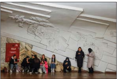
پناه گرفتن شهروندان اوکراینی در ایستگاه متروی شهر کی‌یف از بیم حملات روسیه