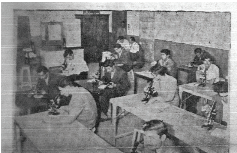
دانشجویان دانشکده پزشکی مشهد در جلسه امتحان دیروز صبح دانشکده پزشکی مشهد مربوط به آسیب شناسی