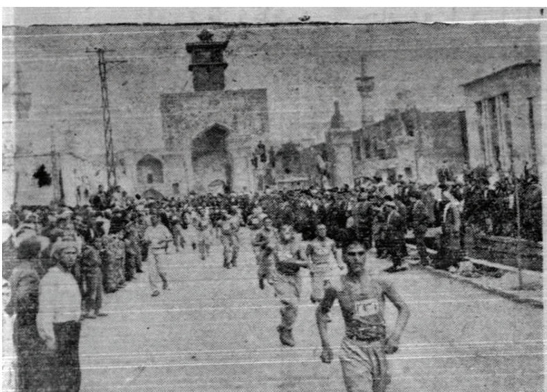
منظره‌ای از مسابقه دو صحرانوردی که دیروز بعد از ظهر در مشهد انجام شد عکس فوق دوندگان را هنگام مراجعت از فلکه آستان قدس نشان می‌دهد.