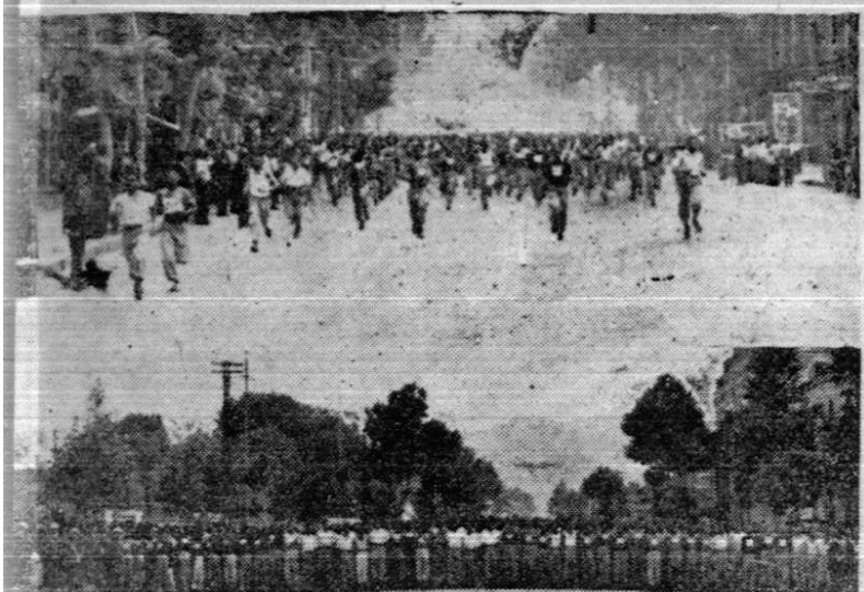
دو منظره از عسابقه دو صحرا نوردی که بعد از ظهر روز پنجشنبه در مشهد انجام یافت، در عکس بالا عده ای از شرکت کنندگان در مسابقه هنگام دویدن مشاهده میشوند، عکس پایین محل ختم مسابقه را نشان میدهد

بدینوسیله از آقای دکتر جراح نوزاد که طفل نوزاد اینجانب را از مرکز حتمی نجات داده تشکر کرده سعادت و موفقیت این دکتر حائق و وظیفه مناس را از خداوند متعال خواستارم.