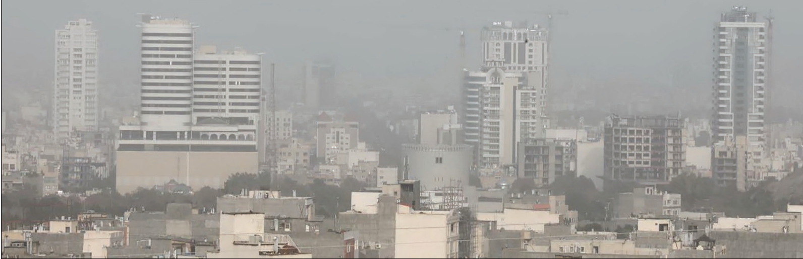
نصویری از هوای آلوده دیروز مشهد