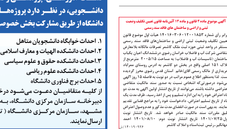
آگهی موضوع ماه۳ قانون و ماده ۱۲ آیین‌نامه قانون تعیین تکلیف وضعیت نرسمی و اراضی و ساختمان‌های فاقد سند رسمی