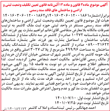
آگهی موضوع ماه۳ قانون و ماده ۱۲ آیین‌نامه قانون تعیین تکلیف وضعیت نرسمی و اراضی و ساختمان‌های فاقد سند رسمی