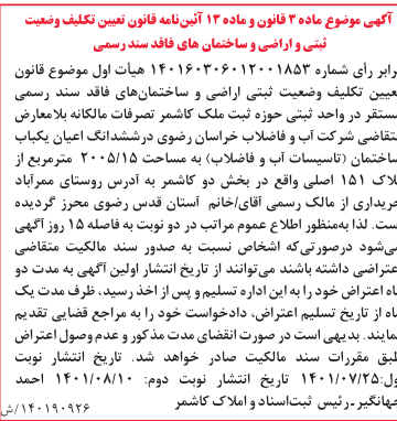
آگهی موضوع ماه۳ قانون و ماده ۱۲ آیین‌نامه قانون تعیین تکلیف وضعیت نرسمی و اراضی و ساختمان‌های فاقد سند رسمی

خبر تولید ۳۳ درصدی سریال میرباقری در حالی اعلام شده که طبق تر آوُرده‌ای موجود، تا به حال ۴۰ قسمت بود، انجام شده و البته در خبرهای بعدی این عدد به ۵۰ افزایش پیدا کرد و حالا بناس‌ت با نظر میرباقری تعداد قسمت‌های سریال به ۶۰ قسمت افزایش پیدا کند که اگر با این افزایش قسمت موافقت شده باشد، ۳۲ درصد اعلام شده، صحیح است.