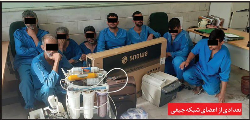
تعدادی از اعضای شبکه جیغی

جذب کرد و باند سیاه‌خود را به «شبکه» تبهکاران شب «گسترش داد که در قالب گروه‌های دویا چند نفره اموال مردم را به یغما می‌بردند. به دنبال اعترافات مرتضی – الف مشهور به مجید جیغی، کارآگاهان پلیس آگاهی پایگاه شمال مشهد، در چندین عملیات ضربتی، ۱۳ تن دیگر از اعضای این شبکه حرفه‌ای و سابقه دار سرقت را در حالی به