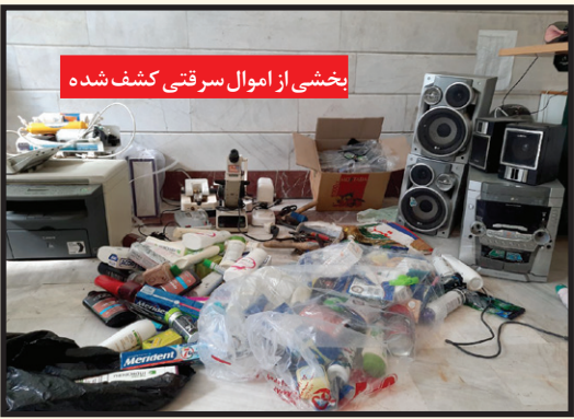
بخشی از اموال سرقتی کشف شده