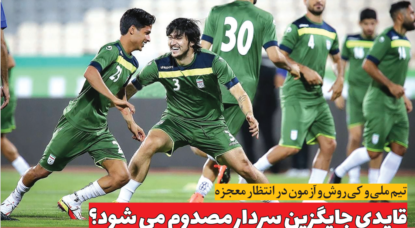
تیم ملی و کی‌روش و آزمون در انتظار معجزه