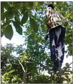
در حالی‌که به روزهای برداشت گردو نزدیک می‌شویم، بسیاری از کاربران شبکه های اجتماعی با انتشار خبرها و تصاویر برخی از کشاورزان‌ی که در هنگام برداشت گردو از درخت‌که‌گاهی تا ارتفاع ۶ متر هم می‌رسد، سقوط کرده و آسیب‌های جدی دیده‌اند از کشاورزان خواستند بیشتر مراقب خود باشند. بر اساس آنچه در خبرگزاری ها منتشر شده سالانه تعداد زیادی سقوط از درخت گردو گزارش می‌شود که ده‌ها کشته می‌دهد. کاربری در این باره نوشت: «کاش یک شرکت دانش بنیان فکری برای برداشت گردو بکنه که شاهد از دست دادن یا مصدوم شدن کشاورز هامون موقع برداشت گردو نباشیم.» کاربری هم نوشت: «گاهی زدن یک گردو از روی درخت باعث از دست رفتن جون یک نفر می‌شه!»