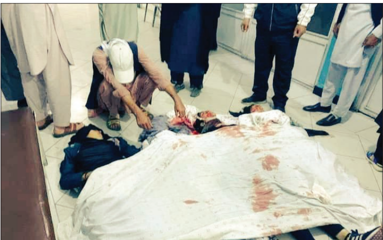
حمله انتحاری به مرکز آموزشی آمادگی کنکور در غرب کابل، ۳۲ شهید و ۴۴ زخمی به جا گذاشت