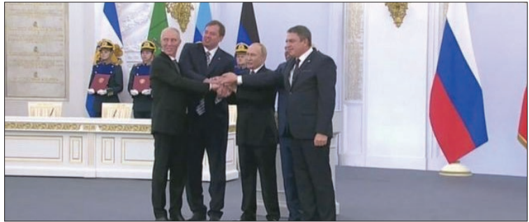
پوتین: پیوستن سرزمین‌های چهارگانه به روسیه، پشتوانه تاریخی دارد. حمله به سرزمین‌های جدید، تنهاجم به خاک روسیه تلقی می‌شود

نبی شریفی - ساعت ۷:۳۰ جمعه ۸ مهر ۱۴۰۱، در حالی که چندصد تن از دانش‌آموزان مقطع پیش‌دانشگاهی در کابل مشغول آزمون دادن بودند، یک تروریست با رساندن خود به سالن امتحانات دست به انتحار زد. دست کم ۳۲ دانش‌آموز این مرکز آموزشی که از اقلیت هزاره بودند شهید و ۴۴ تن دیگر زخمی شدند. بیمارستان اورژانس کابل دقایقی بعد از این حمله