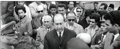
کاپیتولاسیون؛ چوب حراج به غیرت ایرانی

مورخان، کودتای مرداد سال ۱۳۳۲ را نقطه شروع دوران استبداد و سپس، دیکتاتوری محمدرضا پهلوی می‌دانند. ساقط کردن حکومت ملی دکتر مصدق، در واقع پایان دادن به روندی بود که طی یک دهه، بسیاری از سیاستمداران را به ایجاد تحولات بنیادین سیاسی در ایران امیدوار کرده بود. این کودتا، بسیاری از دستاوردهای نهضت ملی شدن صنعت نفت را از بین برد و دوباره، غربی‌ها را در قالب یک شرکت بین‌المللی، موسوم به کنسرسیون، بر نفت ایران مسلط کرد. شاه برای آن که بتواند به آرزوی دیرینه خود، رسیدن به فضای دیکتاتوری عصر پدرش برسد، از روی دستاوردهای ملی مردم ایران به سادگی عبور کرد و بدون هیچ تردیدی، خودش را به دست آمریکایی‌ها سپرد تا با استفاده از قدرت آن‌ها، به ثباتی برسد که گمان می‌کرد همان مشروعبت مورد نیاز برای حکومت کردن است. پیامدهای کودتای ۲۸ مرداد، برای مردم ایران بسیار سخت و ناگوار بود؛ کمتر از چهار ماه بعد از شروع حاکمیت دولت کودتا، راهپیمایی‌های گسترده‌ای برای مخالفت با اقدامات آن آغاز شد، نهضت مقاومت ملی شکل گرفت و در نهایت، واقعه ۱۶ آذر اتفاق افتاد و سه تن از دانشجویان، در دانشکده فنی به شهادت رسیدند. اتفاق اخیر، در ست‌زمانی رخ داد که نیکسون، معاون وقت رئیس‌جمهور آمریکا، برای اعلام حمایت کامل کاخ سفید از شاه به ایران آمد؛ به تعبیر دکتر شریعتی، آن سه دانشجو در مقابل پای نیکسون قربانی شدند.