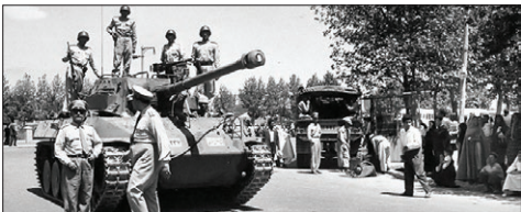
کودتای ۲۸ مرداد؛ غارتگران بازمی گردند

مورخان، کودتای مرداد سال ۱۳۳۲ را نقطه شروع دوران استبداد و سپس، دیکتاتوری محمدرضا پهلوی می‌دانند. ساقط کردن حکومت ملی دکتر مصدق، در واقع پایان دادن به روندی بود که طی یک دهه، بسیاری از سیاستمداران را به ایجاد تحولات بنیادین سیاسی در ایران امیدوار کرده بود. این کودتا، بسیاری از دستاوردهای نهضت ملی شدن صنعت نفت را از بین برد و دوباره، غربی‌ها را در قالب یک شرکت بین‌المللی، موسوم به کنسرسیون، بر نفت ایران مسلط کرد. شاه برای آن که بتواند به آرزوی دیرینه خود، رسیدن به فضای دیکتاتوری عصر پدرش برسد، از روی دستاوردهای ملی مردم ایران به سادگی عبور کرد و بدون هیچ تردیدی، خودش را به دست آمریکایی‌ها سپرد تا با استفاده از قدرت آن‌ها، به ثباتی برسد که گمان می‌کرد همان مشروعبت مورد نیاز برای حکومت کردن است. پیامدهای کودتای ۲۸ مرداد، برای مردم ایران بسیار سخت و ناگوار بود؛ کمتر از چهار ماه بعد از شروع حاکمیت دولت کودتا، راهپیمایی‌های گسترده‌ای برای مخالفت با اقدامات آن آغاز شد، نهضت مقاومت ملی شکل گرفت و در نهایت، واقعه ۱۶ آذر اتفاق افتاد و سه تن از دانشجویان، در دانشکده فنی به شهادت رسیدند. اتفاق اخیر، در ست‌زمانی رخ داد که نیکسون، معاون وقت رئیس‌جمهور آمریکا، برای اعلام حمایت کامل کاخ سفید از شاه به ایران آمد؛ به تعبیر دکتر شریعتی، آن سه دانشجو در مقابل پای نیکسون قربانی شدند.