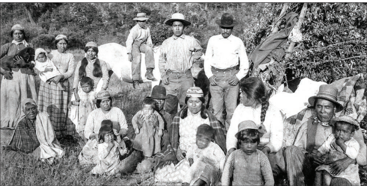
اواخر قرن ۱۹ م- تعدادی از باز ماندگان بومیان کالیفرنیا که اجدادشان توسط سفید پوستان قتل عام شدند