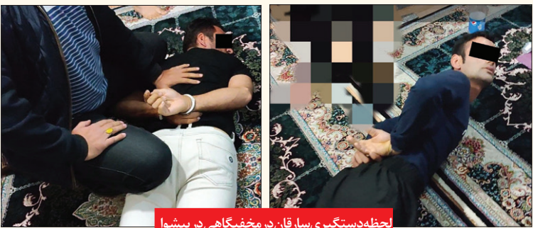
لحظه دستگیری سارقان در مخفیگاهی در پیشوا