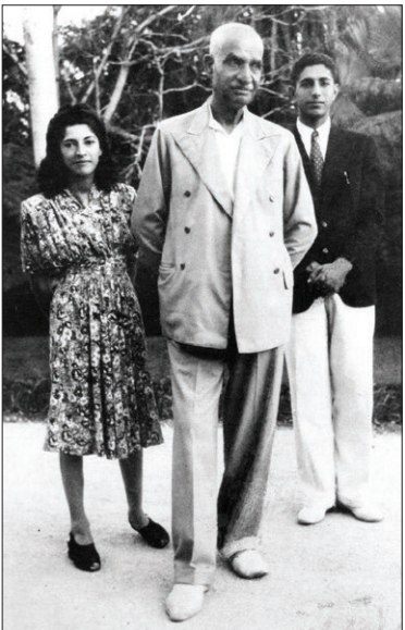
رضاشاه و تن از فرزندانش در ایام تبعید وی در جزیره موریس