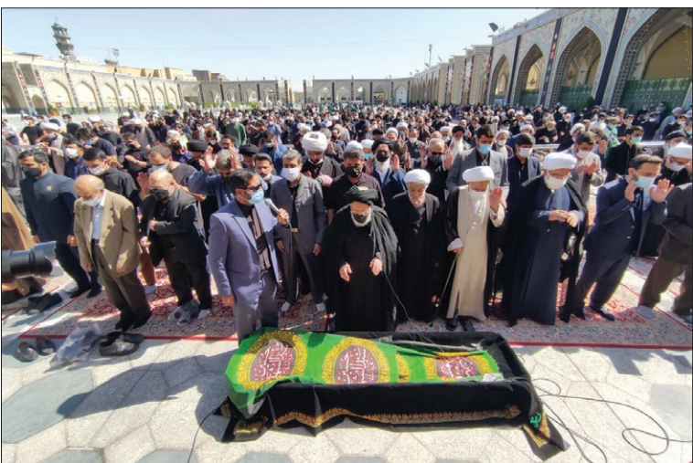
اقامه نماز بر پیکر علامه حکیمی توسط آیت‌ا... سید جعفر سیدان

پیکر علامه محمد رضا حکیمی در حرم مطهر رضوی آرام گرفت