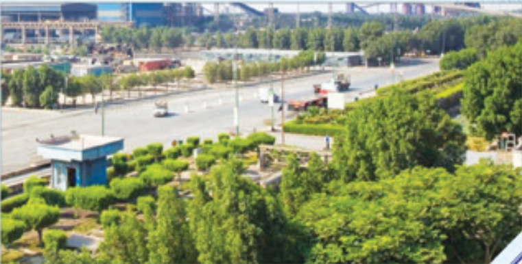
فولاد هرمزگان در حال ساخت است

وی همچنین به پیامد مثبت مالی پیرو عملیاتی شدن این پروژه اشاره کرد و گفت: با انجام این پروژه به میزان ۵ میلیون یورو صرفه جویی ارزی محقق گردیده است. در هفتمین دوره همایش جایزه بهره وری معادن و صنایع معدنی ایران، پروژه کاهش مصرف الکترو د گرافیتی توسط فولاد هرمزگان به عنوان پروژه برتر در زمینه بهره وری در سال ۹۸ انتخاب شد که از سوی خداداد غریب پور معاون وزیر صمت و رئیس هیات عامل ایمیدرو، مورد تقدیر قرار گرفت.