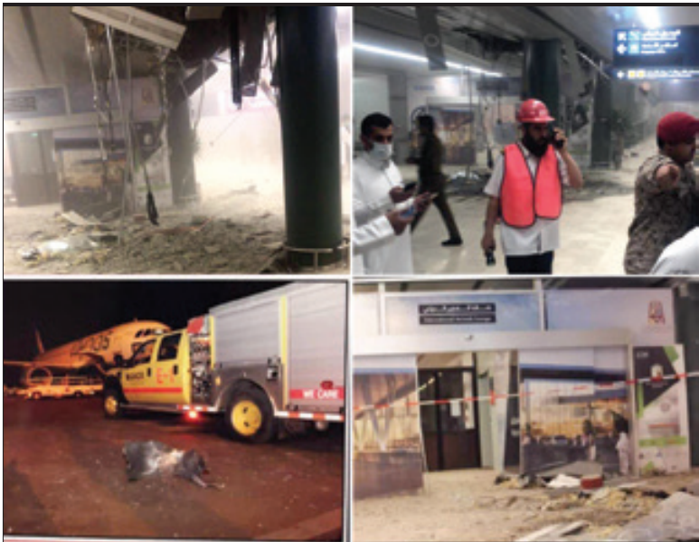
برج مراقبت فرودگاه انبهای عربستان با موشک کروز جدید انصرا... منهدم شد

گروه بین الملل - پس از ابطال انتخابات شهری ها در استانبول احزاب و جریان های سیاسی و به خصوص حزب عدالت و توسعه تلاش زیادی می کند تا در انتخابات مجدد که ۲۳ ژوئن / ۲ تیر برگزار می شود، آرای شهرداری استانبول را به دست آورد. در این فاصله زمانی تغییراتی نیز در مواضع برخی احزاب مانند پ.ک.ک دیده می شود و اکنون این سوال مطرح است که معادلات قدرت و ائتلاف ها تا قبل از برگزاری مجدد انتخابات به کدام سمت و سومی رود؟ در انتخابات محلی و شهرداری های ۲۰۱۹ میزان مشارکت ۸۴ درصد بود. با وجودی که ائتلاف جمهوری مشکل از حزب عدالت و توسعه حرکت ملی ۵۲ درصد آرای مردم را به دست آورد اما در شهرهای مهمی مثل آنکارا، استانبول وازمیر نتوانست به پیروزی دست پیدا کند. اردوغان بارها گفته بود استانبول پیل پیروزی است و برنده واقعی کسی است که آرای این شهر را به دست آورد، انتخابات ۲۰۱۹ او چ دو قطبی شدن انتخابات در ترکیه بود و این روند در انتخابات ۲۱ ژوئن استانبول نیز ادامه خواهد داشت. اردوغان این